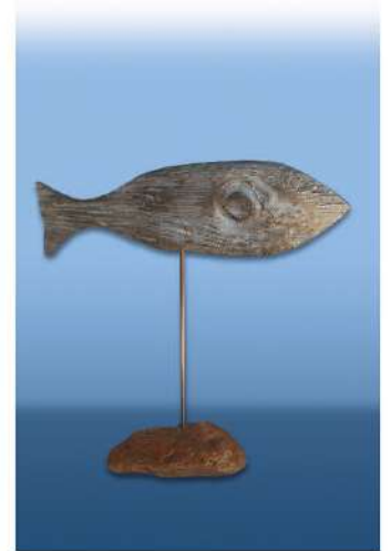
Emili Armengol • Orada - alumini, inoxidable i pedra

Dies 10, 11 i 12 d'octubre de 2020 CASTELLÓ D'EMPÚRIES Vila Comtal